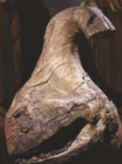
КОНЁК ИЗБЫ нач. XX в.