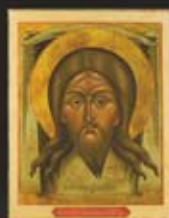
ИКОНА «СПАС НЕРУКОТВОРНЫЙ» 1788 г.