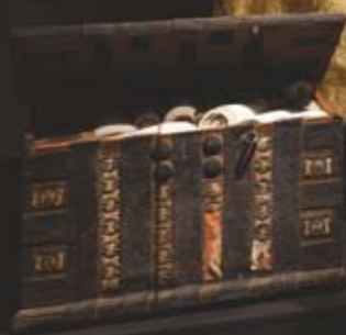
СУНДУК XIX в.