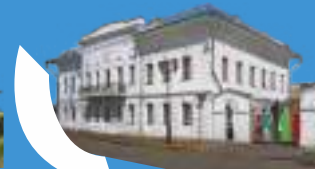
МУЗЕЙ ЗАРУБЕЖНОГО ИСКУССТВА