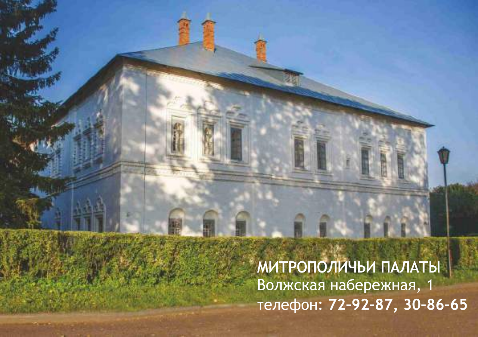
МИТРОПОЛИЧЬИ ПАЛАТЫ Волжская набережная, 1 телефон: 72-92-87, 30-86-65